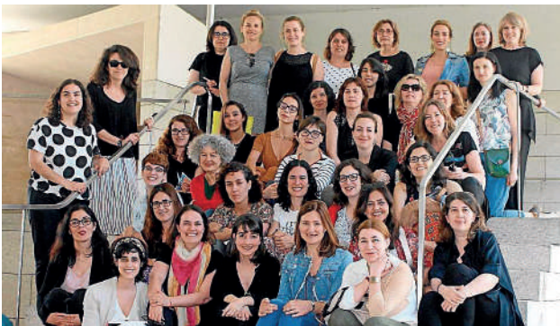
PRENSA O colectivo Xornalistas Galegas nunha xuntanza de 2018 en Santiago.

A Xunta concede os galardóns Comunicar en Igualdade a profesionais e universitarios