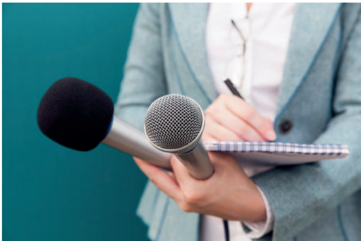
● O premio 'Comunicar en Igualdade' reconece as boas practicas informativas (Xunta).

O Diario Oficial de Galicia (DOG) publica esta terza feira o nome das premiadas no concurso 'Comunicar en Igualdade', que outorga a Secretaría Xeral da Igualdade. Os galardóns distinguen os traballos xornalísticos que contribúen á defensa e difusión dos valores de igualdade entre homes e mulleres así como á loita contra as violencias machistas.