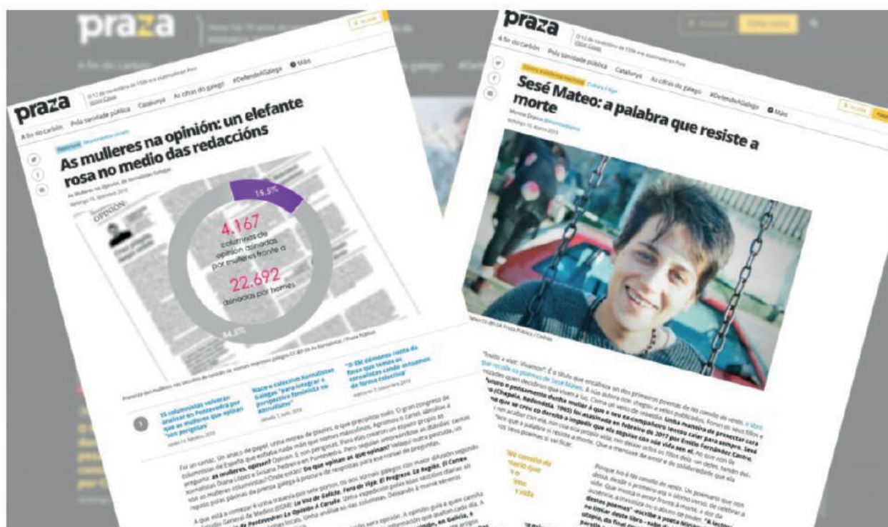
Fragments das reportaxes distinguidas cos galardóns 'Comunicar en Igualdade'