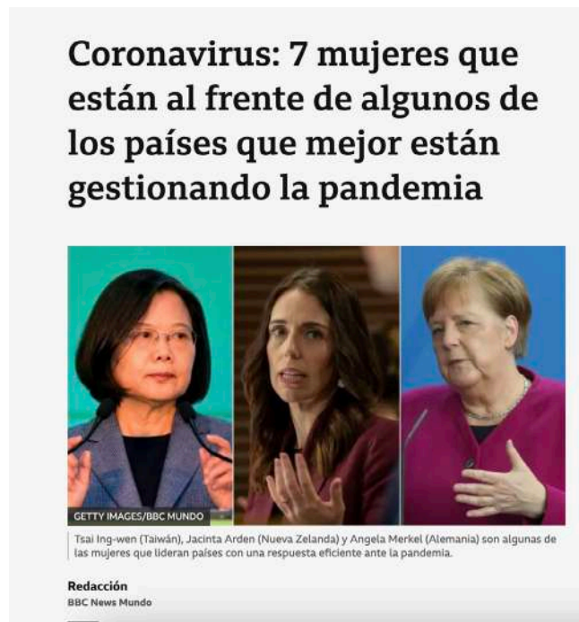
¿Por qué no se les reconocían sus cualidades antes de la pandemia?

situaciones complejas. Y cómo probablemente esas mujeres hayan sufrido el dilema del doble vínculo, es decir, se les ha pedido asimilar una serie de características tradicionalmente asociadas a lo masculino, como el liderazgo fuerte o la ambición, para después destacar de ellas rasgos supuestamente asociados a lo femenino.