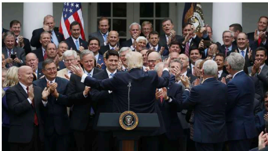
Donald Trump al terminar un acto institucional, rodeado de señores.

all-male pics –al estilo de los all-male panels – dejan fuera de plano a las mujeres, incluso en temas protagonizados fundamentalmente por ellas. Veámoslo con dos ejemplos.