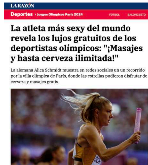
Atleta sin nombre, pero sexy.

En el discurso mediático, este tipo de dinámicas se dan cuando el foco de la noticia o de la imagen se centran en el cuerpo o en la apariencia física, cuando las mujeres se presentan como objetos de deseo para el consumo de la audiencia o cuando se reduce su papel a funciones sexuales o decorativas. Con este tipo de representaciones sexualizadas se perpetúa la visión de las mujeres como cuerpos accesibles, normalizando actitudes de acoso, violencia machista y, en definitiva, cultura de la violación.