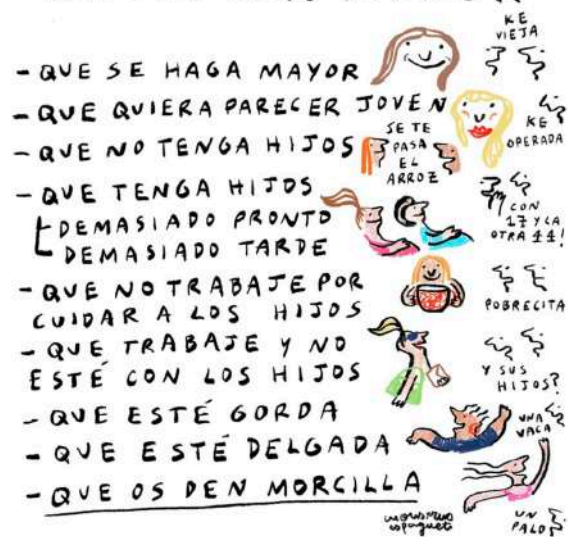
Ilustración de Anastasia Bengoechea (@monstruoespagueti). 2026

incompleta, y sin marido es solterona. Está bien cuidar la vestimenta, pero no nos pasemos, ya que podríamos parecer frívolas. Esto se llama el dilema del doble vínculo : para las mujeres, nunca es suficiente: se nos pide una cosa y su contraria, pero realmente nunca se alcanza el grado de perfección exigible.