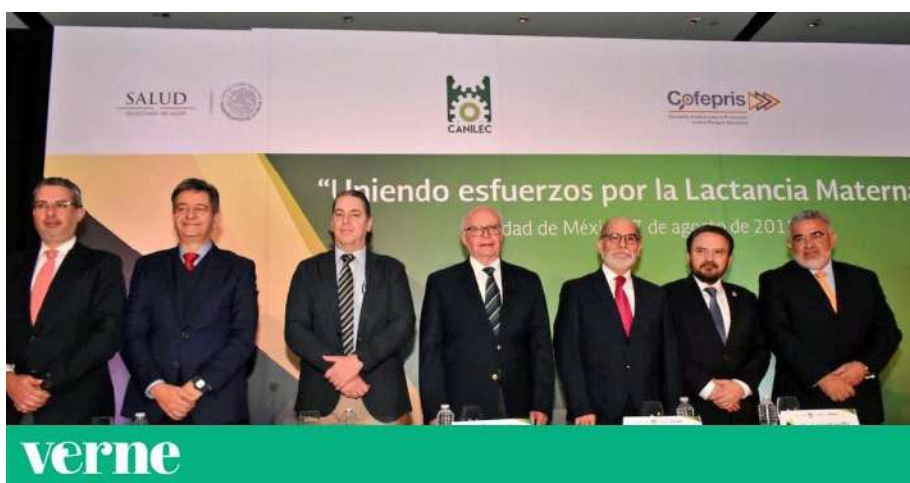
Hombres uniendo esfuerzos por la lactancia materna.

Aunque en este libro no analizaremos a fondo las cuestiones de semiótica visual, cabe destacar que las imágenes contribuyen a generar relato y representación en la misma medida –y en ocasiones, incluso más– que las palabras. Generalmente, los titulares de la prensa junto con las imágenes y vídeos son los elementos que más impacto causan en las audiencias. Y si esas imágenes dejan fuera a las mujeres, contribuyen a su invisibilización.